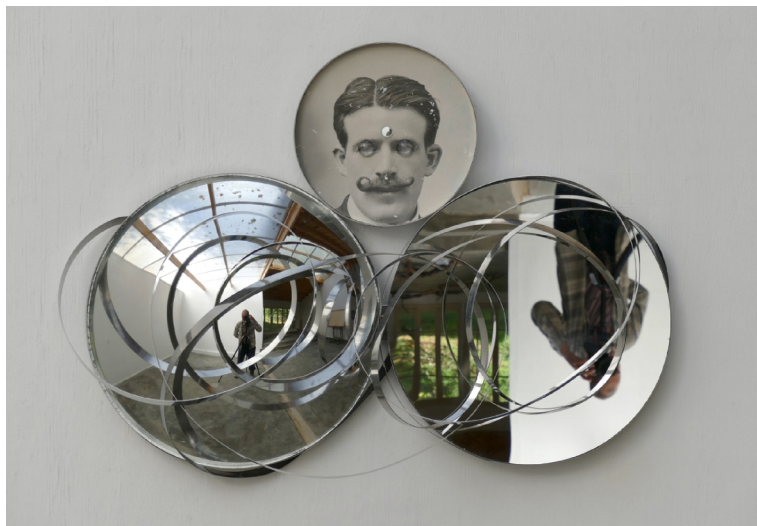
'The Science Deception (Reality is Non Linear)', 2022.

De ‘serieuzere’ kunsten spiegelen zich onbewust naar het model van massamedia en (film)industrie met al hun ‘celebrities’, waarbij natuurlijk dezelfde inflatie van steeds meer helden-op-het-toneel behoorlijk begint te dringen, vergeefs gecompenseerd door helden telkens te vervangen door andere, steeds nieuwere helden, volgens het deflatorische principe van de ééndagsvlieg. Overall ‘bruist’ de kunst, vooral op instagram – om nergens meer te kunnen bekijken.