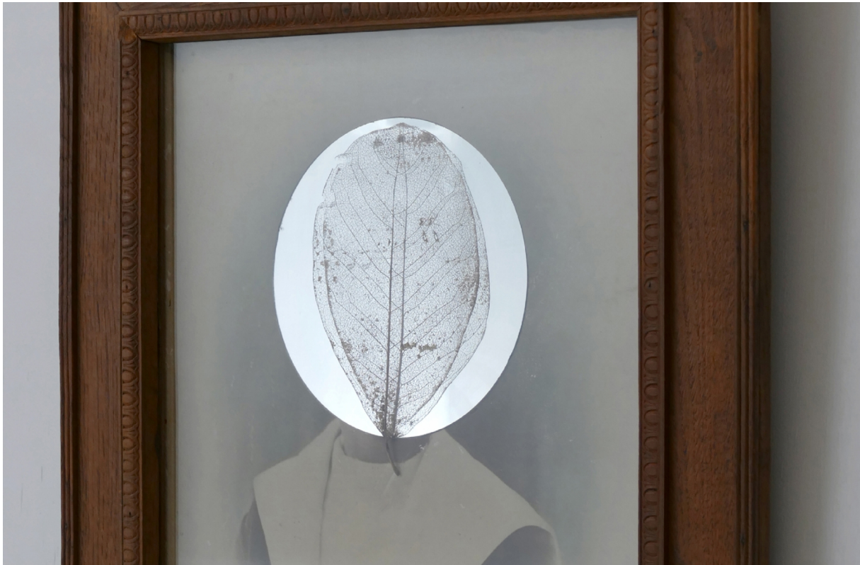
Simulacrum (4) - ieder blad is heel het woud en heel het woud is ieder blad. Ook ieder blad is ieder ander blad', 2022. detail.

Hoewel er tientallen, zo niet honderden voorbeelden te noemen zijn waarbij onze vrijheid op wereldwijde schaal op dusdanig ernstig wijze in het geding is, en zelfs talloze mensen uit de hoogste regionen van de macht zouden kunnen worden geciteerd in welke mate een kleine, onzichtbare elite over onze vrijheid 'wikt en beschikt', wil ik me zoals gezegd in dit artikel met name richten op de psychologische kant van het begrip vrijheid, en niet op manipulatie van achter de schermen. Temeer daar reeds genoemde verdringing vruchtbare meststof is voor het voortbestaan van de Deep State en de decennialange tendens om ieder dissident geluid, zelfs iedere kritiek en open discussie, liefst zo snel mogelijk als conspiracy theorie af te doen, het grote stigma van deze tijd. Een stigma dat langzamerhand aan kracht lijkt in te boeten (tenslotte zit de geschiedenis vól met complotten – ook jij, Brutus?) Vandaar de nieuwste trend die iedere vorm van kritiek (' disinformation ') nu het label "staatsterrorisme" tracht te geven, waarbij voor de toehoorder eigenlijk al voldoende wordt aangetoond dat er in werkelijkheid van maar één vorm van staatsterrorisme sprake is, nl. die van de staat zelf.