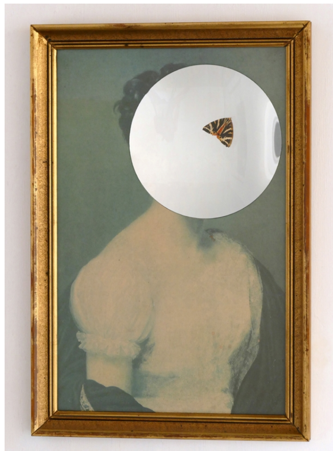
'Simulacrum (3) - Reality is just Appearances', 2022.