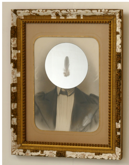
‘Simulacrum (1) – Het geheel begint niet vanaf de fragmenten’, 2022.

De kracht van het spontane leidt ons naar het wezenlijke, echte en ware, want ze is zo goed als ongefilterd en ongeremd. Maar toch is het ‘spel’ van de kunstenaar niet zoals het spel van het kind dat goeddeels nog onbewust is. Het spel van de kunstenaar is een ‘gecontroleerd’ spel dat, alle spelregels negerend, vooral een beschouwen is, een alert en afwachtend waar-nemen. Dat wil zeggen een opmerkzaam en aandachtig trachten te resoneren binnen het geheel van gedachte-handeling en materie, tot het ‘juiste’ zich aan komt dienen en tijdig als het ware wordt her-kent.