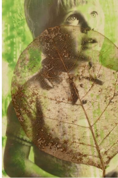
'Nous (Circuitus spiritualis)', 2022, detail.