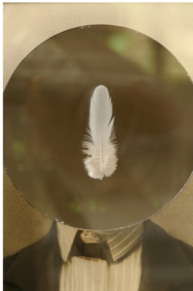
'Simulacrum (1) – Het geheel begint niet vanaf de fragmenten', 2022, detail.

Met pseudo-denken of pseudo-creatie doel ik steevast op denken en handelen dat niet het resultaat is van eigen activiteit. Een denken en handelen dat niet geworteld is in het zelf . Het hele punt is in de eerste plaats niet wát wordt gedacht, maar hóe gedacht wordt. De gedachte en het kunstwerk dat resultaat is van actief denken, is steeds nieuw en oorspronkelijk. Daarentegen kan iemand vele 'rollen' spelen en toch overtuigd zijn dat hij in iedere rol "zichzelf" is, terwijl in werkelijkheid het oorspronkelijk zelf volledig door het pseudo-zelf wordt verstikt.