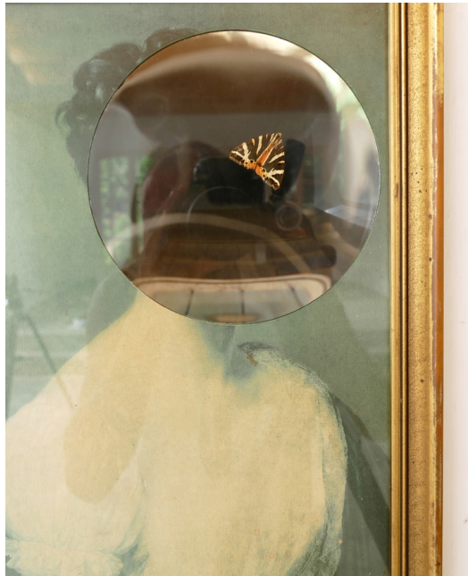
'Simulacrum (3) - Reality is just Appearances', 2022, detail.

Let op het subtiele maar essentiële onderscheid tussen het woord cultuur en beschaving. Dit “geweld” kan ook mediamiek, intellectueel, ideologisch, ‘wetenschappelijk’ en via allerhande politiek correcte mechanismen plaatsvinden. Sterker, politieke correctheid impliceert in zichzelf een geestelijke gewelddadige houding richting iedere ‘incorrectheid’ (denk aan Woke)