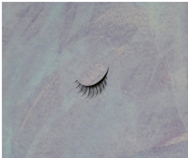
'Fear for Freedom', 2022. detail.

Hoe zit het dan met de angst voor vrijheid? De bekende uitspraak dat de mens vaak ‘t meest angstig is voor z’n eigen licht geeft alvast te denken. Vanwaar anders heeft de staat tegenwoordig bijna een totale aanspraak kunnen verwerven op het doen en laten van het individu? Genoemde citaten van Jung maakten al duidelijk dat er een conflict bestaat tussen individuele belangen om zichzelf in vrijheid te kunnen ont-wikkelen (indivduatie) en de ‘staat’ als modernste vorm van ‘contrat-social’ (Rousseau). In feite is er helemaal geen sprake is van enig contract, want voor een contract is wederzijdse vrijwillige instemming vereist. Geboorte-aangifte bij de burgerlijke stand is echter verplicht, een burgerservice nummer en belasting betalen eveneens. Heeft men ons ooit hiervoor om toestemming gevraagd? Straks komt daar een digitale identiteit overheen, eerst nog met QR-code via de slimme telefoon, vervolgens via lichaamseigen implantaat. Allemaal voor onze eigen vrijheid?