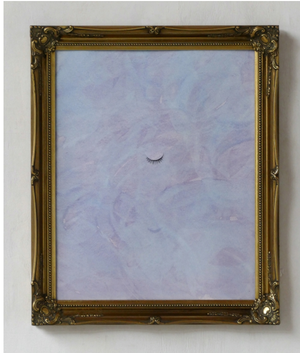
'Fear for Freedom', 2022.

Over artistieke, maatschappelijke en spirituele vrijheid.