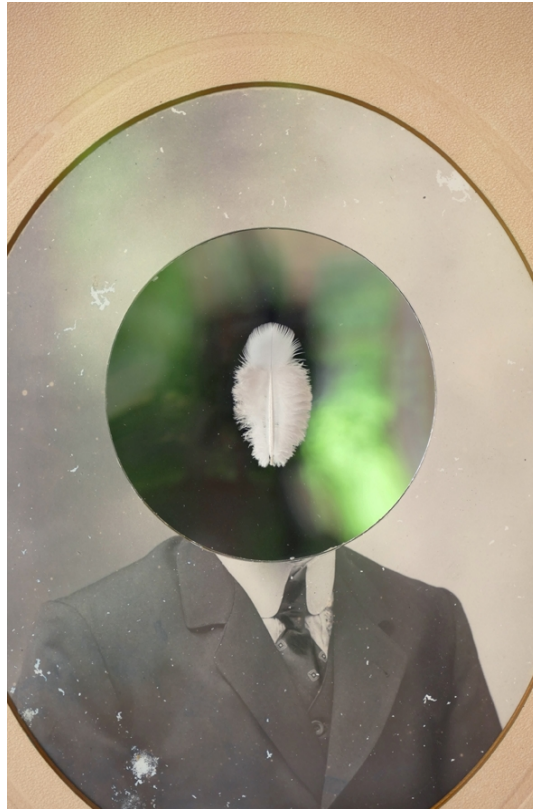
'Simulacrum (2) - Wie de rondgang in zichzelf maakt, vindt zichzelf', 2022. detail.

“Ons geslacht vormt zich slechts van aangezicht tot aangezicht, en slechts van hart tot hart menselijk. In wezen ontwikkelt het zich slechts in nauwe, kleine kringen, die zich geleidelijk uitbreiden in gratie en liefde, in zekerheid en trouw (...) De vorming tot menselijkheid is in z'n oorsprong en in z'n wezen eeuwig de zaak van het individu en van instellingen die zich nauw aansluiten aan zijn hart en aan zijn geest. Ze zijn in alle eeuwigheid nooit de zaak van mensenmassa's. Ze zijn in alle eeuwigheid nooit de zaak van de civilisatie” [Ibidem].