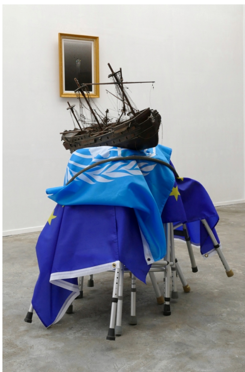
'The Rape of Europa' -2022 & 'Human Genome Project', 2022.