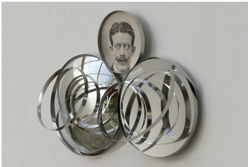
'The Science Deception (Reality is Non Linear)', 2022.

Het totalitaristische fenomeen van massavorming – dat geenszins beperkt is tot z'n vroege verschijningsvormen van nazisme of stalinisme, maar in andere gedaante de technocratische samenleving karakteriseert – verschaft de mogelijkheid voor het individu om zich te verliezen. Zelfs in die mate, dat het individu in het geheel niet telt. Het individu, teruggebracht tot een stofdeeltje of een atoom, hield volgens Hitler ook in afstand doen van het recht op een eigen mening, eigen belangen en eigen geluk. "Er werd een hiërarchie ontworpen waarin iedereen wel iemand boven zich heeft om zich aan te onderwerpen, en onder zich om zich heerser over te voelen." (...) "Het opgeven van spontaniteit en individualiteit komt neer op een blokkering van het leven. Psychologisch beschouwt is de menselijke robot biologisch wel in leven, maar dood naar ziel en geest. Terwijl hij de bewegingen van het leven uitvoert, glijdt zijn leven als zand door zijn vingers. Achter een façade van tevredenheid en optimisme is de moderne mens diep ongelukkig; in feite staat hij op de rand der wanhoop" 5 ). Keren wij nog bijtijds om s.v.p?